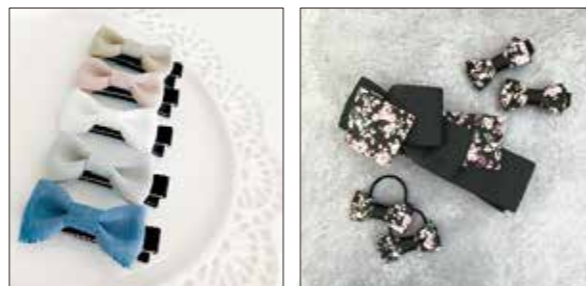
▲国産リボンヘアクリップ