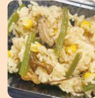
▲ふっくらつやつやの具沢山おこわ!