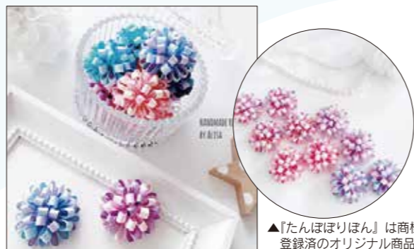
▲『たんぼほりほん』は商標登録済のオリジナル商品!