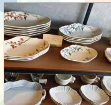
▲ラウンド型の使い心地の良い食器の数々。