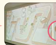
② 写真撮影を行うと、自分が明太子に加工されていきます(笑)