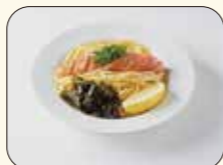
▲できたてめんたいバスタ。よくあるたらこバスタと違います!!