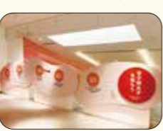
▲辛子明太子のクイズが楽しめます