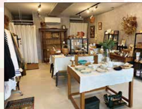
▲店主のこだわりの品々が取り揃えてある店内。