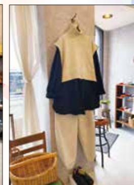
▲コーディネートも提案してくれます。