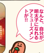
なんと、自分が明太子になれるのが!!! メン