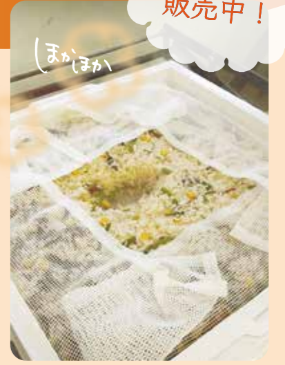
▲自社工場で、ていねいにまひまかけてじっくり蒸しています♪