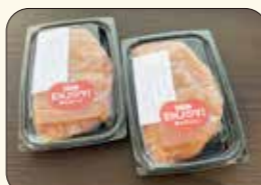
▲工場から八十八歩で店頭と並ぶことから「八十八歩めんたい」。300gで1,680円(家庭用)♪弾けるようなプチプチ感が平日も売り切れるほど人気!!