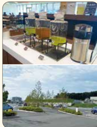
▲1Fはオフィス、2Fはマーケットとレストランに工場見学施設に。総合的に明太子を味わい楽しめる施設でもあり丘の上なので景色も綺麗♪時々、キッチンカーで明太フランスやめんたい唐揚げの販売もしています。