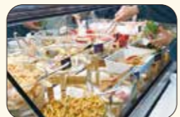
▲セットはビュッフェ付き! できたてめんたい、明太ポテトサラダもあり、種類が盛りだくさん!! ドレッシングも充実しています。