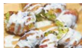
▲大人気のレタス巻 ▼肉厚の豚バラ串

ビッグベアーズさんと同じ建物の奥にあるやきとりバル暖らんさん。今年の3月に4周年を迎えました。人気メニューは、豚足、漬込み唐揚げ、豚バラ、レタス巻など。特に豚バラは肉厚でボリュームがあると評判です! 店主チョイス「暖らんパック」は20本 2,700円から50本 5,940円(税込)と、とってもお得! もちろん50本以上も受付可能! 配達には宇美町全域 500円! 6,000円以上のご注文で配達料金は0円になります! 最新情報はInstagramをチェック!!