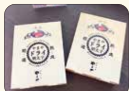
▲熟成した明太子を丁寧に乾燥させた「やまやドライ明太子」。常温なのでお土産にもおつまみにも人気です!

できたてめんたいから明太子加工品、お酒やフルーツ、お肉に至るまで、九州の食文化の一端を楽しめるマーケットです。お土産から家庭用まで幅広く明太子を中心としたグルメが入手できます!!