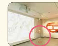
① こちらに立ちます。