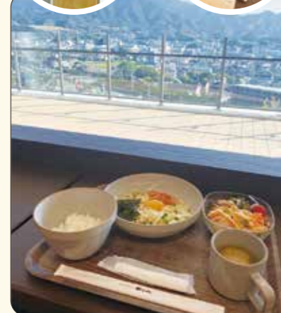
▲篠栗の山々を眺めながらゆっくりのんびり。写真はできたてめんたい釜玉うどんセット!! セットの方はサラダビュッフェにご飯味噌汁お替わり自由♡