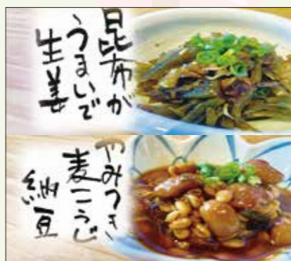
▲上質の材料を使用した栄養価たっぷりのお惣菜。

宇美町の集団健診、皆様受診されていらっしゃるでしょうか? 後日の健診結果説明会の際に無料で配布されている100mlの『うす塩醤油』は、実はマルト醤油さんで製造されているこだわりのお醤油なのです。宇美町役場健康課様では『高血圧ゼロの町プロジェクト』を推進中の為、その取組の一環としてうす塩醤油を配布されているとのこと。もうすでに『うす塩醤油』のリピーターの方が店舗に購入にいられているそうです。一般の減塩の醤油は、味気なく旨みが足りないイメージがありますが、このお醤油は無理なく減塩習慣を続けられるよう旨みを凝縮し、違和感なく味わえる様に工夫されたそうです。また秋口よりお惣菜メニューも開発。子どもさんもお年寄りの方も食べやすい優しい味付けが特徴。根昆布や生姜、麦麴や納豆などごはんのお供にもなる体が喜ぶ材料ばかり! 店舗や各種イベントにて販売中です♪