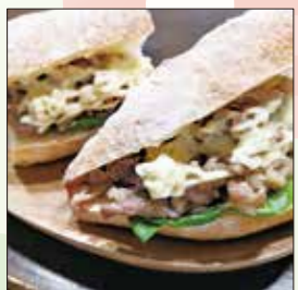
▲プルコギビーフ味。