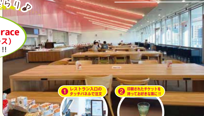
① レストラン入口のタッチパネルで注文