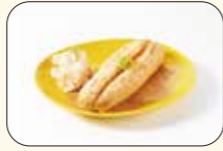
▲焼きたて明太フランス。

広々としたレストランは、とても眺めが良くゆったりとできます。タッチパネルで注文し、その場で電子決済の流れになっています!! 工場が出来上がったばかりの明太子を味わえるメニューが色々です♡