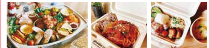
▲クリスマスオードブル 3,500円(税込) ▲醤油麹入りナポリタン ▲日替わりランチ

JR宇美駅前のmarumicafeさんは、令和4年5月にオープン後一年が過ぎ、今年ではイベントでの各種麹調味料の販売なども人気です。クリスマスは昨年に引き続きオードブル盛り合わせを受付中。今年は、ご年配の方や2~3名の集まりでも気軽に召し上がって頂けるようなサイズ感、価格感を意識されたそうです! オードブルのお申し込み期限は12/19(火)19時まで。受け取りは12/24(日)15時~19時まで。もちろん通常テイクアウトもOK(当日注文OK/容器代サービス)! クリスマスオードブルは、Instagramメッセージかお電話にてご予約下さい!