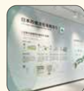
▲やまやさんは「九州の食文化を発信する」ことをミッションとされ、新たな事業を次々と展開されているそうです。