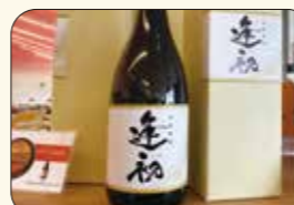
▲やまや蒸留所ではお酒造りも! 逢初はすっきりとした後味で飲みやすい芋焼酎だそうです!