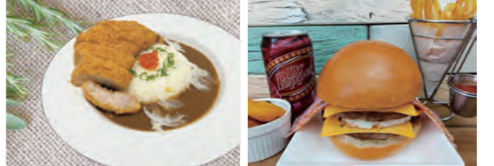
スマイルラボの一押し!! 四元豚のカツカレー♪ 厳選肉の使用の手作りパテのハンバーガーも大人気!!

スマイルラボさんは、1年前に宇美町若草に新規オープンをした、カレーとハンバーガーの専門店！ちょうど1年となり、近日にハンバーガーメニューを一新される予定です。一番の特徴は、20種類のスパイスを使って、たっぶりの餡色に炒めた玉葱をブレンドしたカレー♪ 一般的なカレーよりスパイシーで味の深みがかさぐさ、今までにないクセになる味と一番人気。基本のクラフトカレーから、野菜や四元豚が乗ったカレーまで色々あります。ハンバーガーは、地元精肉店から厳選肉を仕入れた手作りパテを使用！お野菜も地元市場から仕入れた国産野菜でリピーターの方も多いそうです♪