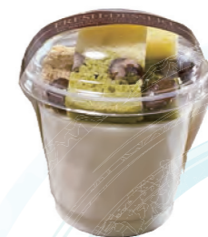
うみプリンパフェ