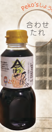
Peko'sしょうゆ 合わせ たれ

お魚の煮付けや、肉じゃが、すき 焼きなどの煮込み料理の味の決め 手になる万能合わせ調味料です。材 料によって生姜や梅干しを入れたり して風味の違いを楽しめます!