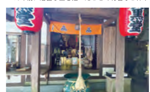
▲かの幸運な宝くじをきっかけに造られた大黒堂