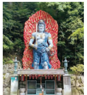
▲天地眼を持ち悪いものから守ってくれる不動明王