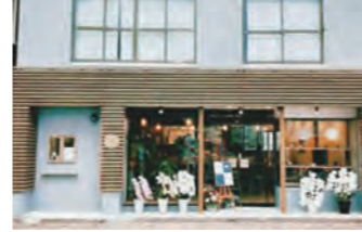
昼やティータイム以外にも夜もおつまみとお酒あり！