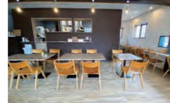
コンセントやwifiもあります♪ゆったりとした店内