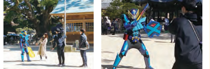
ゴミ拾いボランティアをするばってんジャーさん ばってんジャーポーズ!!

去る3月6日日曜日に、ばってんジャーさんが、宇美八幡宮のゴミ拾いボランティアをされるとのことで取材に行きました！ちょうどこの日は、ケーブルテレビ福岡さんがメインで取材に来られており、その取材の様子をこちらが遠くから撮らせて頂く形。ばってんジャーさんは、子どもさんと触れ合いながら、ゴミ拾いをしたり、お菓子を配ったりのボランティア。ゴミ拾い後は、参拝に来られているご家族や子どもさんと触れ合いながら写真撮影をされており、皆さん喜ばれていました♪