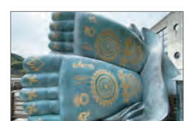
▲仏足跡も礼拝の対象とされています