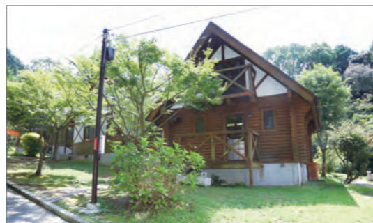
▲ロッジサイトは、トイレやキッチン、お風呂も設置されています♪

TEL：092-595-2110（9:00～17:00 / 月曜休園日以外） ※各種予約はホームページから予約システムサイトへアクセス下さい。