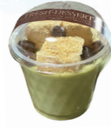
うみプリン抹茶味