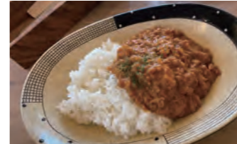
鶏カレーは実は隠れ人気！癖になる食べ応えのあるお味