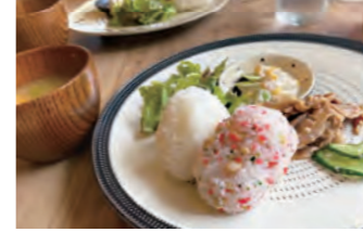
日替わりランチは塩麹を入れて炊いたお米に具沢山海味汁♪