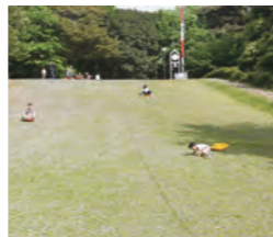
▲草ソリ場もあります