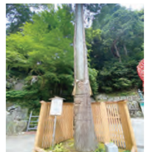
▲40年前に落雷し生き返ったことで有名なご神木