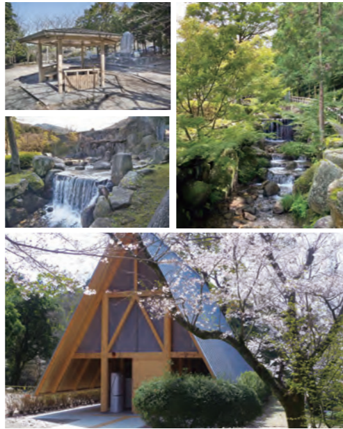
▲綺麗な水洗トイレが2箇所に設置されました♪

利用料金はゲートで後払い。 3時間以内無料 6時間以内500円 以降6時間毎500円 ※路上駐車禁止