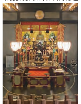
▲大師堂では秘剣大師空海の像を安置。年に1回の厄祓祈願には7千件の申し込みに