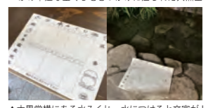
▲大黒堂横にある水みくじ。水につけると文字が！