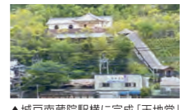
▲城戸南蔵院駅横に完成「天地堂」