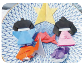
▲刺身皿にのった、店長の作った折り紙たち♪