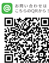
お問い合わせはこちらのQRから！