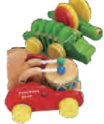
▲おもちゃの「プルトイ (pull-toy)」。