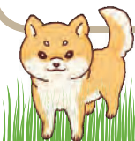
一案内役のさきやんです！