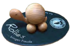
▲ヨーロッパ製のカメのおもちゃ。足がコロコロと回り、背中の丸い部分がそれに合わせてコロコロと回ります♪