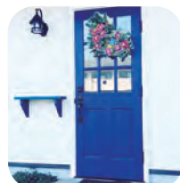
▲カントリー調の素敵な建物です♡

すべき第一回は、宇美町光正寺2丁目の「nono-hana」さんです。バス通りの裏の通りの可愛い青い扉が目印。カフェやレンタルスペースとして、特に女性の間では知る人ぞ知る場所。