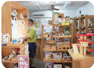
▲国内外の木のおもちゃが自然のぬくもりを醸し出しています。

隣町から宇美町に引っ越し、新しい土地でのお店や飲食店やスーパーを自分で探したりして、何となくあちこちに通うようになりました。そのひとつが西鉄ストアです。時折食料をここでこさえて、お惣菜やさんの出口から出た所に商店街の通りがあり、木のおもちゃ屋さんが見えます。名前は「ほしとタンポポ」さん。宇美町の催事でお会いするようになり、それがきっかけで最近お店にふらっと寄らせて頂いたのです。中には、所狭しと、やさしい国内外の木のおもちゃがたくさん。そして紙細工や折り紙もたくさん…！